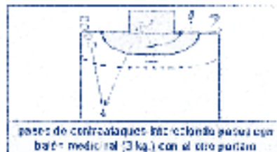
pases de control queques intercambiando pases con balón medicinal (3 kg.) con el otro portero