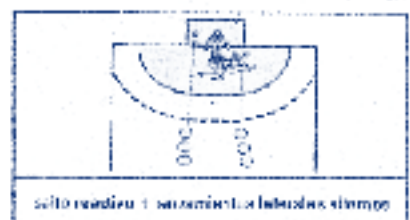
salto rousdno + lanzamiento de balón aéreo