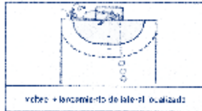
vchco + lanzamiento de balón localizado

Este método permite infinitas posibilidades de trabajo, tanto con el simple hecho de realizar series de lanzamientos rápidos, alternando puestos específicos que requieran desplazamientos o cambios expeditivos de orientación. Como combinando los gestos técnico-tácticos del portero con tareas: de coordinación, equilibrio y agilidad; o con ejercicios de fuerza, tales como saltos, o pases con balón medicinal. He aquí algunos ejemplos de combinaciones: