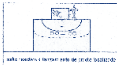
salto rousdno + lanzamiento de balón localizado