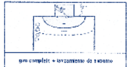
gto completo + lanzamiento de balón