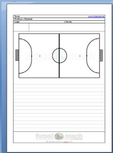
Apuntes Campo horizontal

Plantillas para tomar apuntes en cursos y ponencias Campo completo horizontal